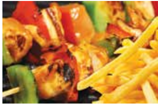
Shish tawook شيش طاووق 160.00