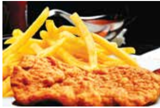
Veal escalope pane اسكالوب بانيه 175.00