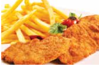
Chicken pane فراخ بانيه 225.00