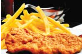
Veal escalope pane اسكالوب بانيه 350.00