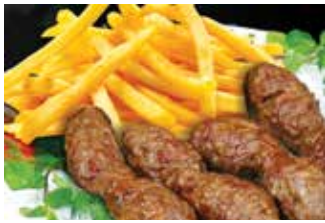
Grilled kofta كفتة مشوية 245.00