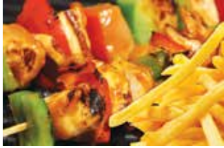
Shish tawook شيش طاووق 225.00