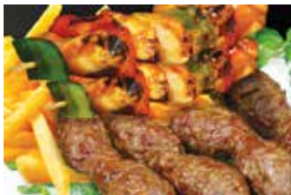
Mixed grill مشويات مشكلة 250.00

جميع الوجبات تقدم مع أصابع البطاطس المحمرة All Meals served with French Fries